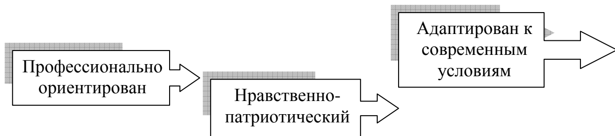
Рис. 2. Модель выпускника МОБУ ДОД «ДЮСШ» города Волхов

Для формирования образа выпускника в учреждении создается образовательное пространство, в котором каждый субъект образовательного процесса сможет самоопределиться, само реализовать, почувствовать и прожить «ситуацию успеха». В таком образовательном пространстве сформируется потребность в здоровом образе жизни, будет обеспечено овладение уровнем базовых знаний и даны представления о культурных и нравственных ценностях, где раскрываются потенциальные возможности каждого через спортивную деятельность и социальную политику.