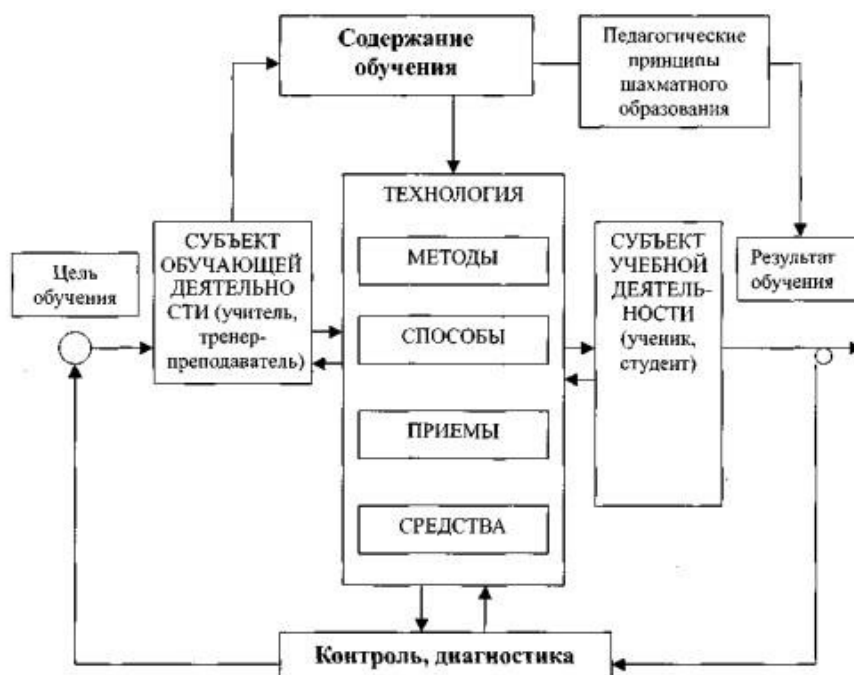
Рис. 1. Структура целостного педагогического процесса

Фундаментальность курса шахмат на практике означает овладение богатым арсеналом технических средств и приемов ведения борьбы на всех стадиях партии. Например, применительно к середине игры это означает знание и умение применения технологий разыгрывания типовых позиций миттельшпиля.