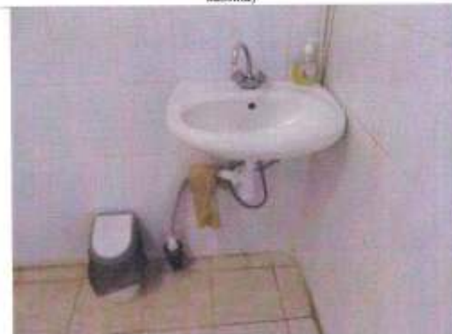
Фото №28 – Санитарно-гигиеническое помещение (раковина)