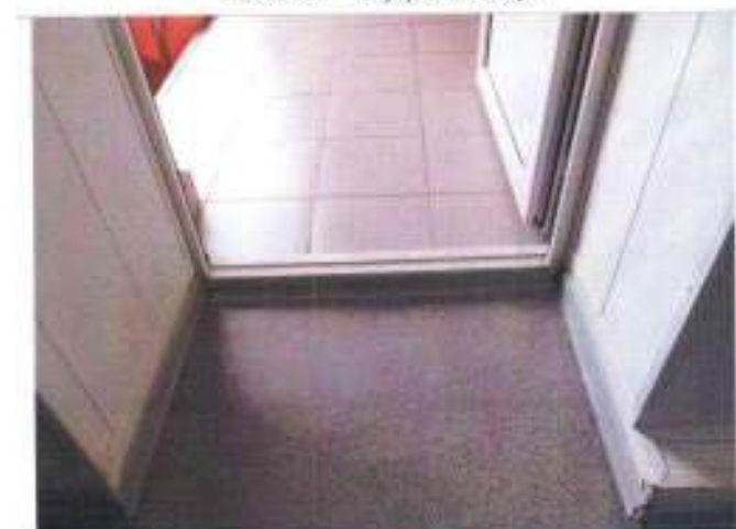
Фото №18 – Внутренние двери