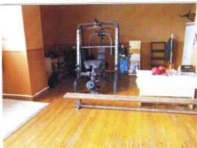
Фото №21 – Зальная форма обслуживания