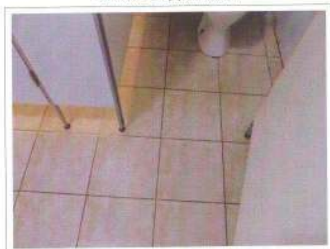
Фото №15 – Внутренние двери