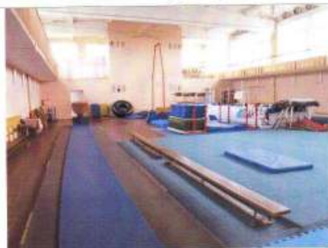
Фото №23 – Зальная форма обслуживания