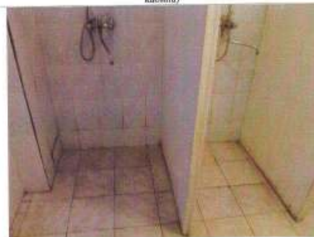
Фото №29 – Санитарно-гигиеническое помещение (душ)