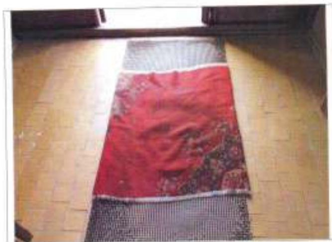
Фото №7 – Тамбур