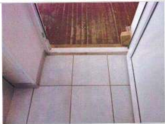
Фото №19 – Внутренние двери