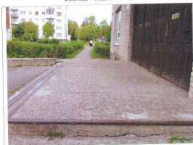
Фото №5 – Входная площадка главного входа