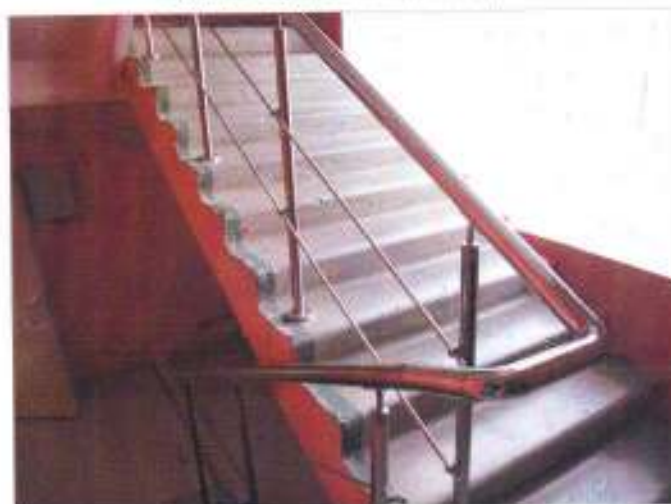
Фото №10 – Внутренние лестницы