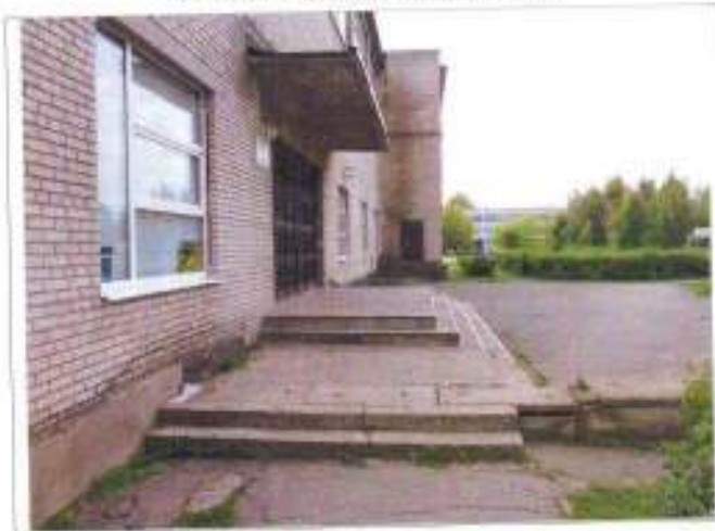
Фото №3 – Главный вход