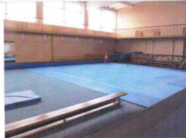
Фото №24 – Зальная форма обслуживания