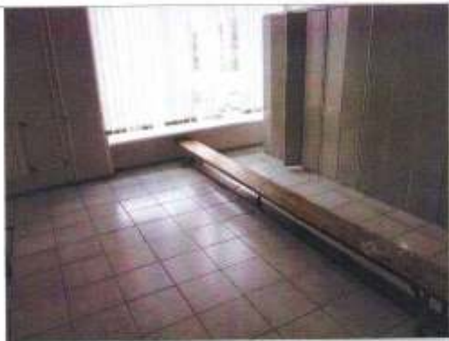
Фото №25 – Рядовалка