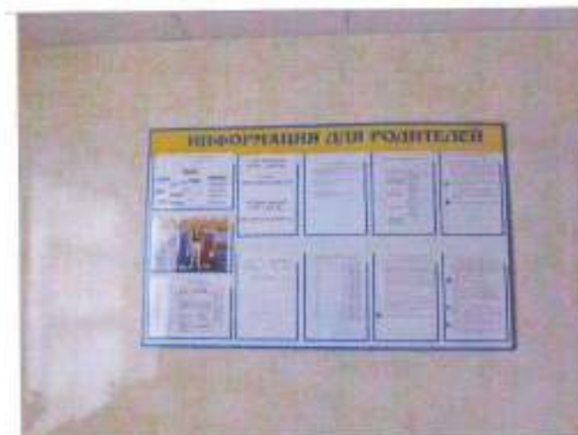
Фото №30 - Система информации