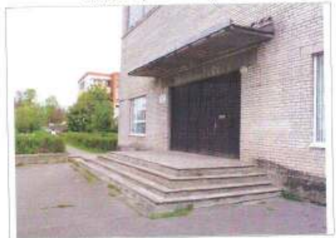
Фото №4 – Наружная лестница главного входа