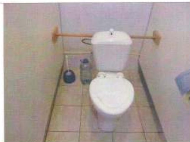
Фото №26 – Санитарно-гигиеническое помещение (туалетная кабина)