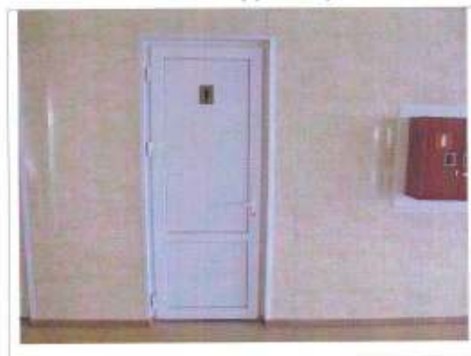
Фото №16 – Внутренние двери