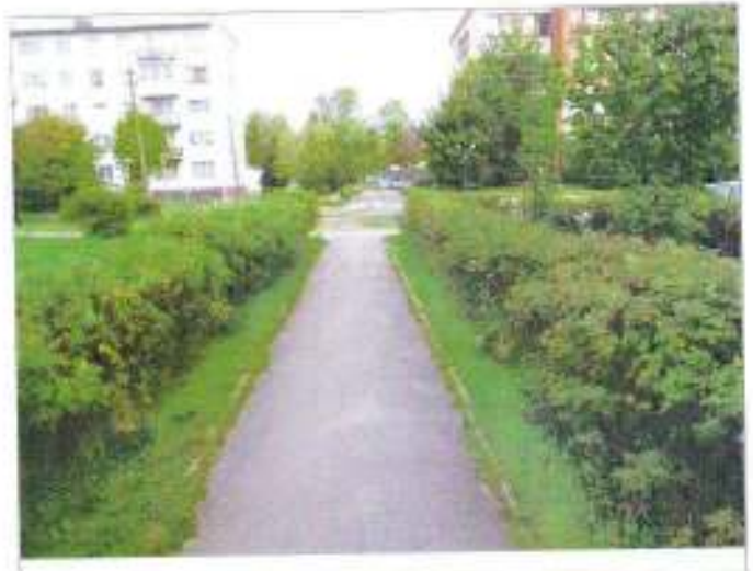
Фото №2 – Прилегающая территория