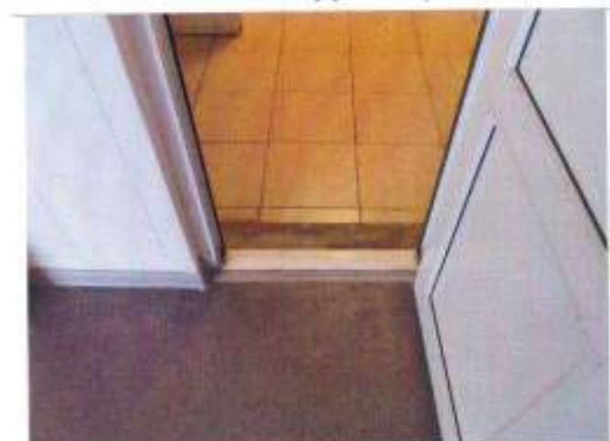
Фото №17 – Внутренние двери