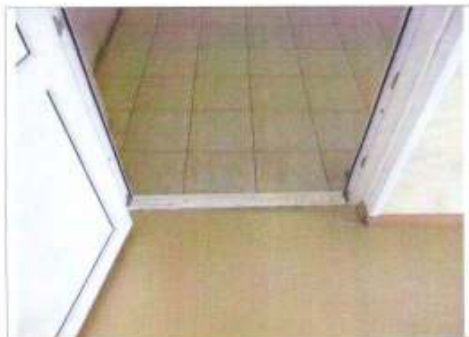
Фото №14 – Внутренние двери