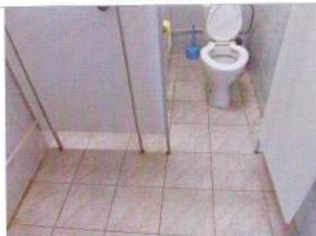
Фото №27 – Санитарно-гигиеническое помещение (туалетная кабина)