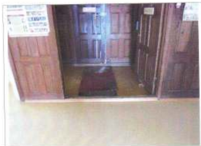
Фото №8 – Внутренняя входная дверь