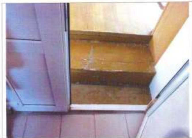
Фото №13 – Внутренние двери