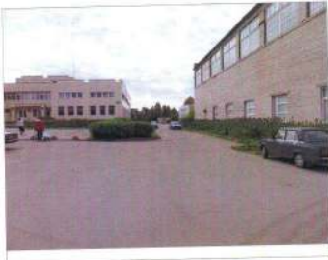
Фото №1 – Прилегающая территория