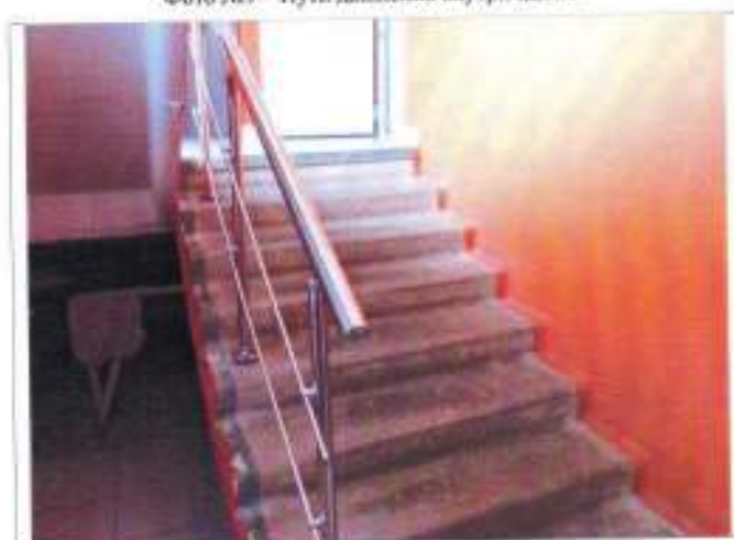
Фото №11 – Внутренние лестницы