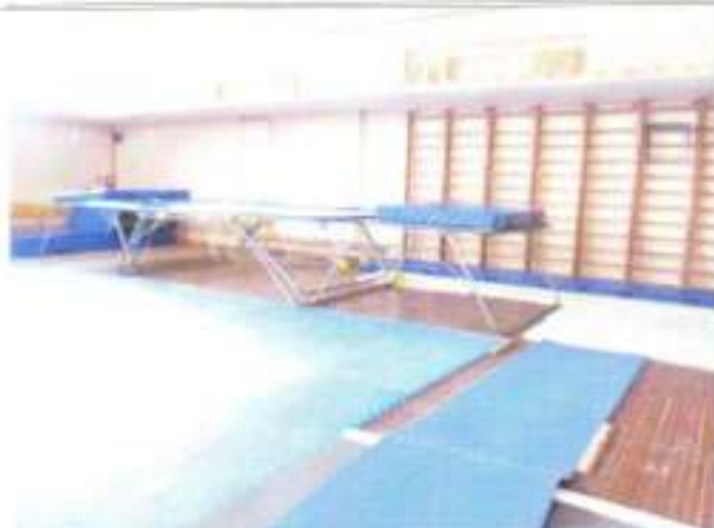
Фото №22 – Зальная форма обслуживания