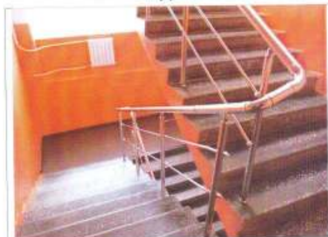
Фото №12 – Внутренние лестницы