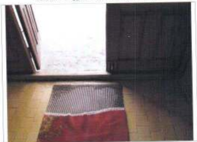
Фото №6 – Наружная входная дверь