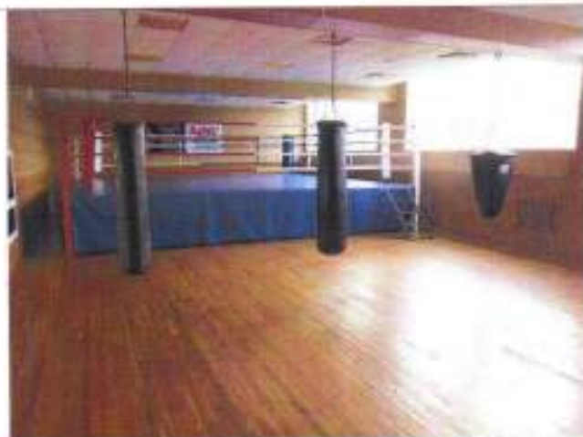
Фото №20 – Зальная форма обслуживания