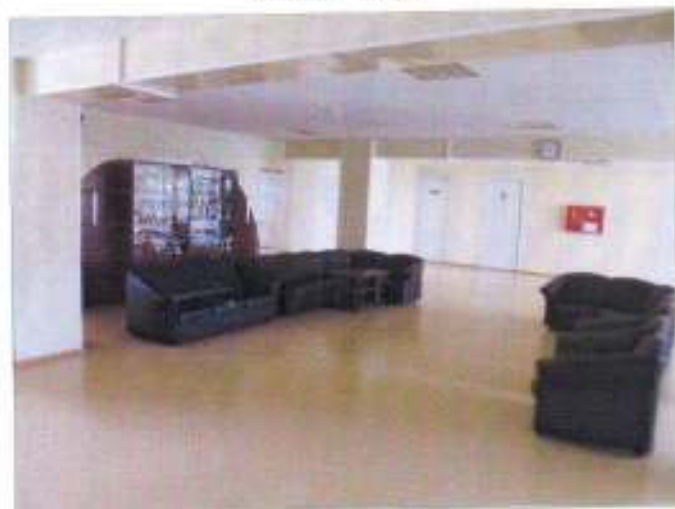
Фото №9 – Пути движения внутри здания