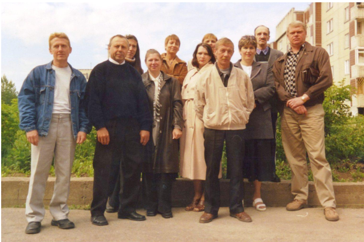
Педагогический и административный персонал ДЮСШ города Волхов в 2006 году: