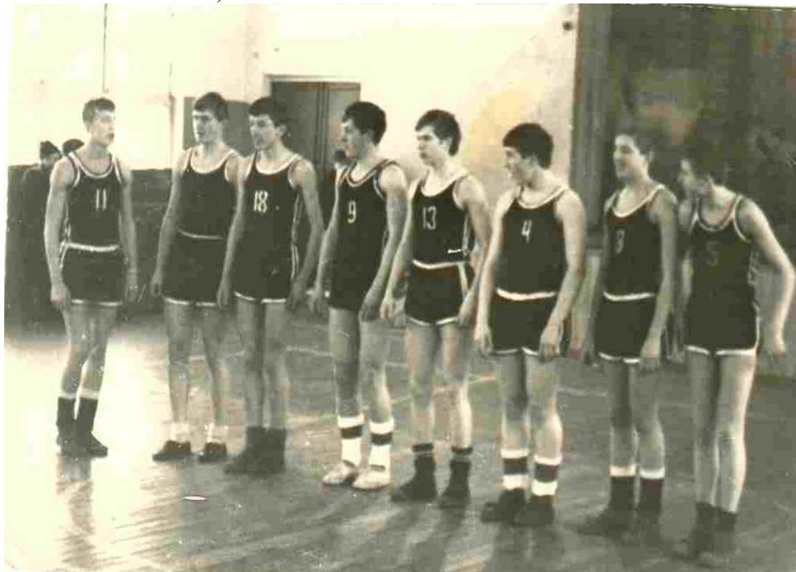
Сборная ДСШ города Волхов - чемпион Лен. ОБЛОНО по баскетболу 1967 года